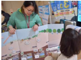
北海道大学総合博物館（2019年度事業）