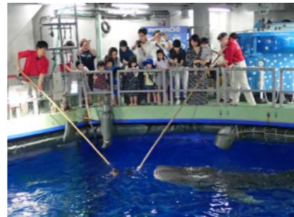
いおワールド かごしま水族館 (2019年度事業)