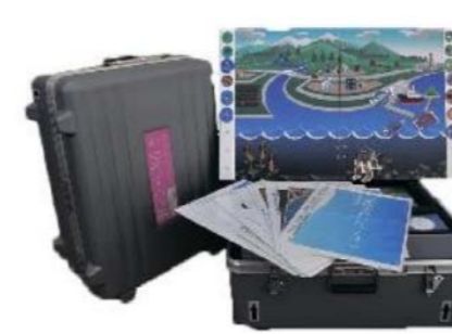
様似郷土館 (2018年度事業)