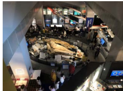
ミュージアムパーク茨城県自然博物館 (2020年度事業)

あなたの館ならではの切り口で、「海の学び」を生む企画展の資金をサポート。企画展及び関連するイベントもサポートします。