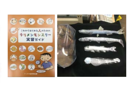
きしわだ自然資料館 (2018年度事業)