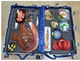
青森県営浅虫水族館（2019年度事業）

なお、これらのテーマについては、当該年度以降もプログラム2「海の博物館活動サポート」で募集をしておりますので、お気軽に事務局までご相談ください。