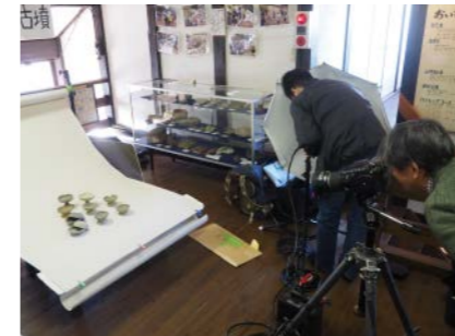
名古屋市博物館 (2017年度事業)

あなたの館ならではの、オリジナリティのある「海の学び」をカタチにするために。準備のための調査・研究活動の資金をサポートします。