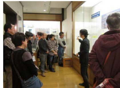
千葉県立関宿城博物館 (2017年度事業)