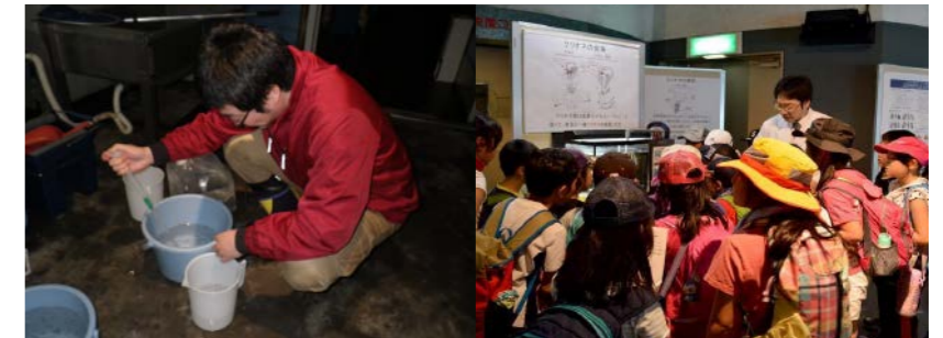
蘭越町貝の館 (2015年度事業)