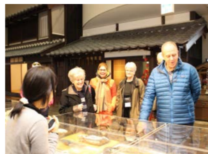
御食国若狭おばま食文化館 (2019年度事業)