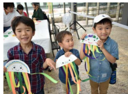
長崎県美術館 (2017年度事業)