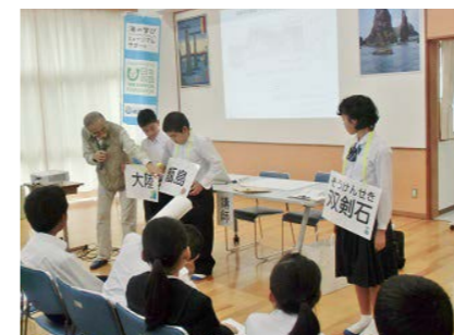
南さつま市坊津歴史資料センター輝津館 (2015年度事業)

学校教育現場と社会教育施設の連携による、次世代への海をテーマにした新たな学びの機会をサポート。