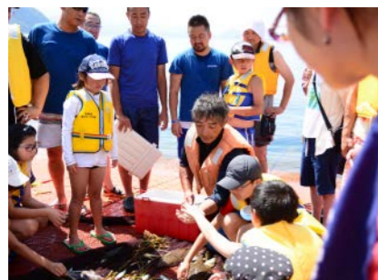
青函連絡船メモリアルシップ八甲田丸 (2015年度事業)