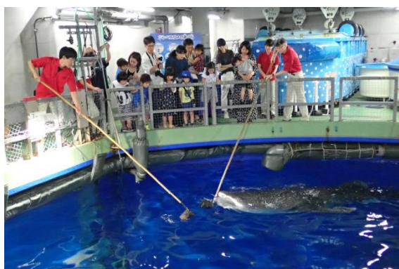
ジンベエザメの食事をまぢかで見学