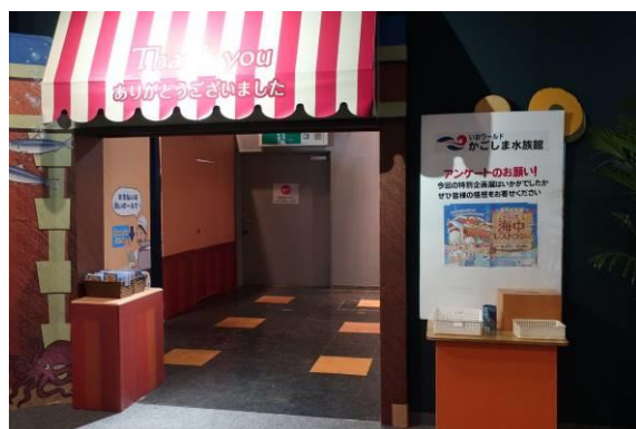
企画展出口に設置