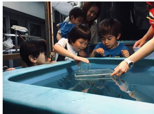
目を輝かせてエサを食べる様子を観察する

当館では、開館以来「体験！一日飼育係」と「大人のための体験飼育係」いう自主事業を行っている。対象は、「体験！一日飼育係」が小学4年生から中学生まで、「大人のための体験飼育係」が高校生以上である。いずれも人気講座であり内容も充実し、学習効果も十分ある。このノウハウを活かして様々な飼育生物にえさを与え、その様子を観察して多様な環境に生きる生きものとその食べ物や食べ方について楽しく学んだ。アンケートからその目的を達 ※上記写真等は特別な許可を得て撮影されたものです。無断転載等はいけません。