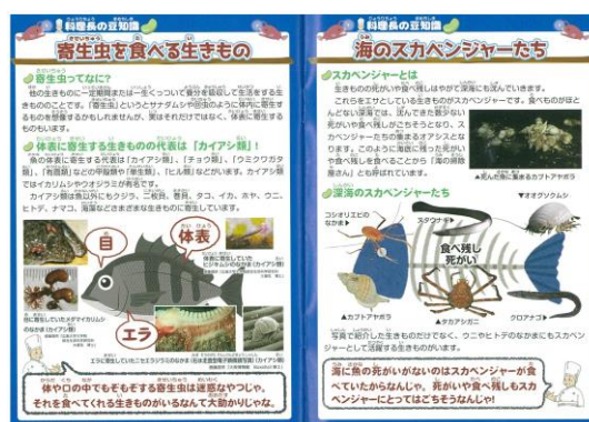
リーフレット（えほん）