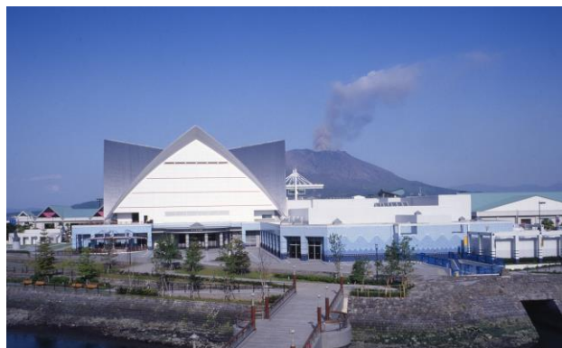
いおワールドかごしま水族館 外観