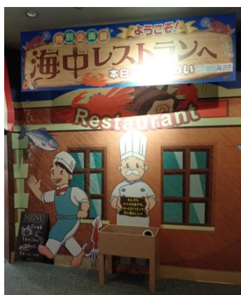
入口でボールを1つ取り 各コーナーのクイズに挑戦！