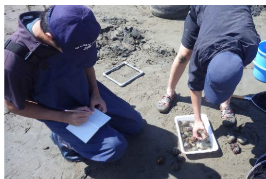
阪南市尾崎海岸での調査 (2017 年 9 月 18 日)