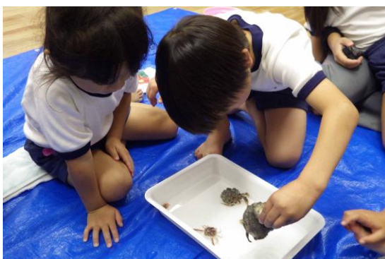
東葛城幼稚園への出前授業①

得られた結果をもとに、岸和田市立光陽中学校科学部の生徒と共同で、データの整理、とりまとめを行い、「大阪湾ヤドカリ図鑑」を作成した。作成した図鑑は、2017年10月に学校文化祭において展示を行った。本事業の取り組みを知ってもらうことは、生徒や教職員をはじめとした学校関係者に、大阪湾を身近なものと考えてもらい、海へ足を運ぶきっかけとなることが期待できる。また、2018年2月12日に大阪府泉南市民センターで開催された第16回「私の水辺大発表会」で成果の発表を行った。参加者からは、「大阪湾にヤドカリが20種類もいることに驚いた」、「まだまだ新しい発見がある大阪湾って面白い」、「今後も継続して調査を続けて欲しい」等の意見をいただいた。また、この発表会では、同じ泉州地域で活動している他団体との交流も行い、今後の海の学びに関する活動の広がりにつながる貴重な機会になったと思われる。