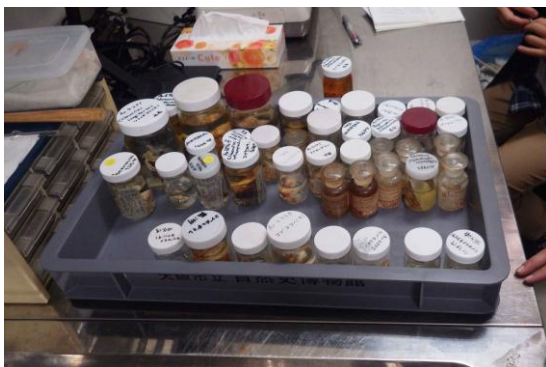
大阪市立自然史博物館での標本調査③