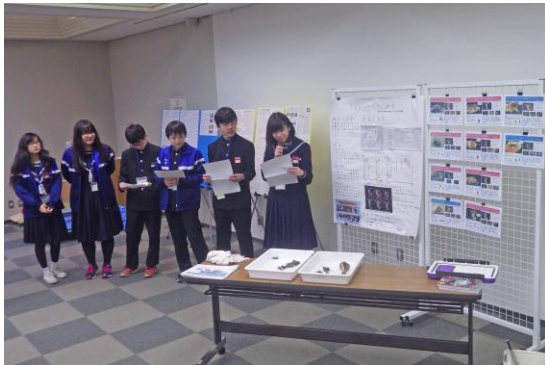
私の水辺大発表会での発表①