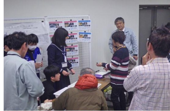
私の水辺大発表会での発表②