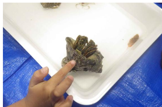
東葛城幼稚園への出前授業②