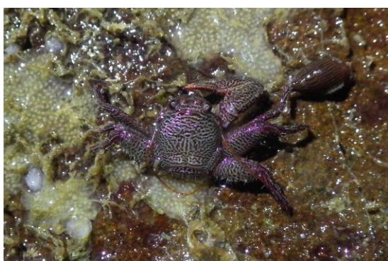
和歌山市田倉崎海岸で確認されたショウジョウカニダマシ (2017 年 11 月 19 日)