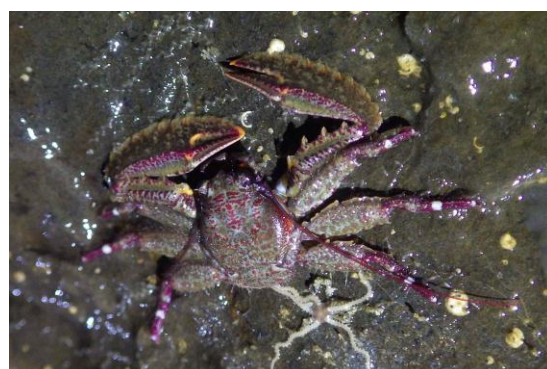
和歌山市城ヶ崎海岸で確認されたオオアカハラと思われる個体 (2017 年 12 月 21 日)