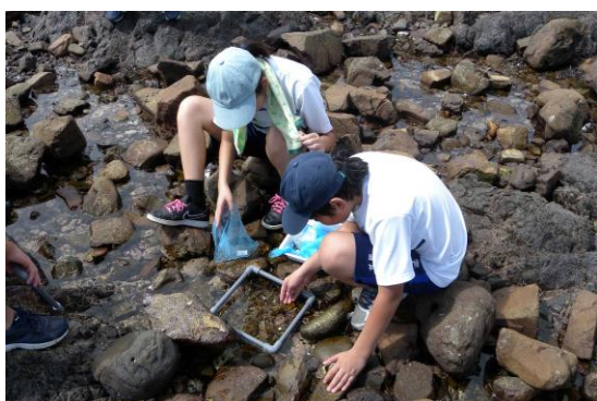
和歌山市城ヶ崎海岸での調査 (2017 年 8 月 25 日)