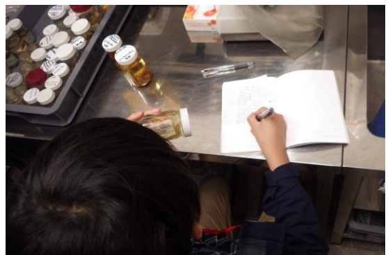
大阪市立自然史博物館での標本調査④