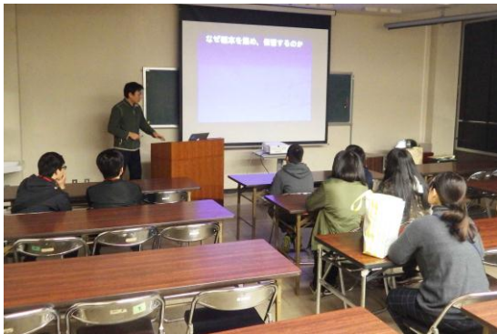
大阪市立自然史博物館での標本調査①